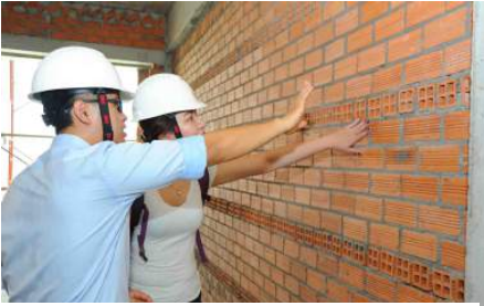
"Mục sở thị" giúp khách hàng mãn nhãn khi tham quan thực tế căn hộ