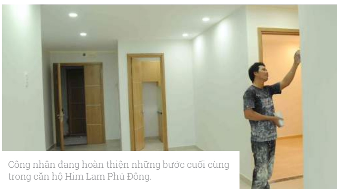
Công nhân đang hoàn thiện những bước cuối cùng trong căn hộ Him Lam Phú Đông.