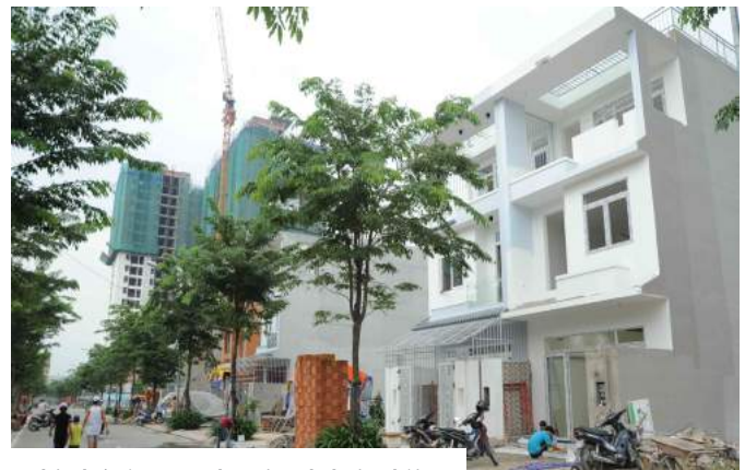
Nhà phố Him Lam Phú Đông đã hoàn thiện.

Các căn hộ hiện tại đang có giá bán từ 1,4 – 1,7 tỷ, so với giá ban đầu 1,1 -1,3 tỷ; gia tăng trên dưới 30% giá trị ngay cả khi chưa tới thời hạn bàn giao nhà. Giá đất nền tại khu vực cũng có sự gia tăng nhanh chóng, giá dao động từ 2,8 – 4,5 tỷ so với lúc đầu từ 1,8 -2,5 tỷ; gia tăng trên dưới 50%, đặc biệt có những vị trí đẹp giá tăng tới 100%.