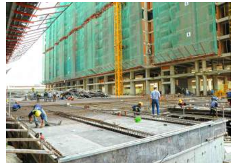
Hồ Bơi đang thi công hoàn thiện