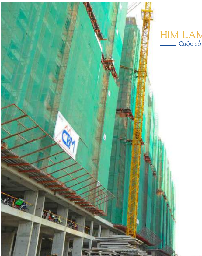
Ăn theo hạ tầng khu Đông và khu liên hợp thể thao Rạch Chiếc, giá bán căn hộ Him Lam Phú An cũng đã tăng từ 100-300 triệu so với cách đây hơn 1 năm.