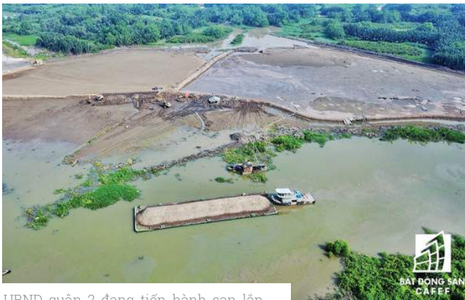
UBND quận 2 đang tiến hành san lấp mặt bằng một số khu vực