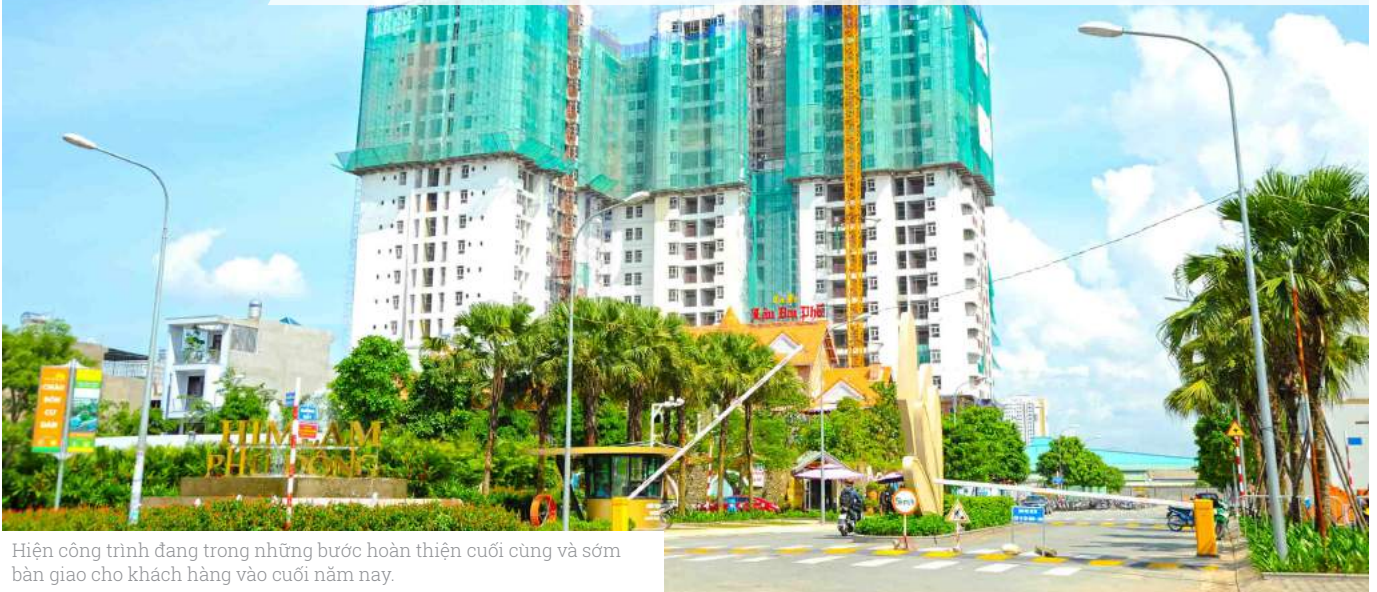
Hiện công trình đang trong những bước hoàn thiện cuối cùng và sớm bàn giao cho khách hàng vào cuối năm nay.

H im Lam Phú Đông, khu dân bán biệt lập nằm tại cửa ngõ phía Đông Sài Gòn; bao gồm căn hộ và nhà thấp tầng mặt phố.