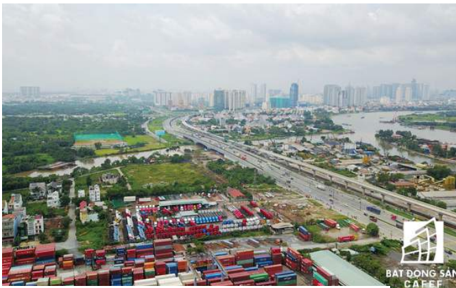
Đặc biệt, tuyến metro số 1 đang được nối dài thông suốt từ quận Thủ Đức đến quận 1, TPHCM.