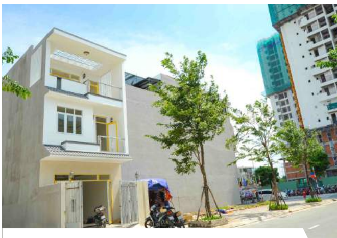
Những dãy nhà phố khang trang được hình thành