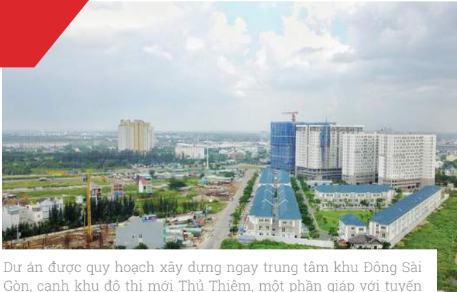
Dự án được quy hoạch xây dựng ngay trung tâm khu Đông Sài Gòn, cạnh khu đô thị mới Thủ Thiêm, một phần giáp với tuyến đường cao tốc TPHCM - Long Thành - Dầu Giây, một phần giáp với đường Mai Chí Thọ, Xa lộ Hà Nội.