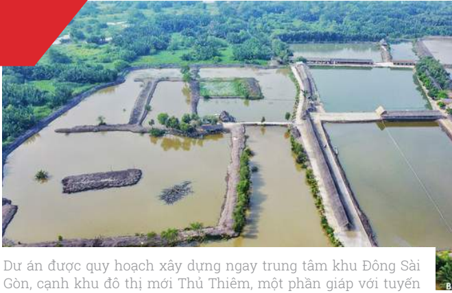
Dự án được quy hoạch xây dựng ngay trung tâm khu Đông Sài Gòn, cạnh khu đô thị mới Thủ Thiêm, một phần giáp với tuyến đường cao tốc TPHCM - Long Thành - Dầu Giây, một phần giáp với đường Mai Chí Thọ, Xa lộ Hà Nội.