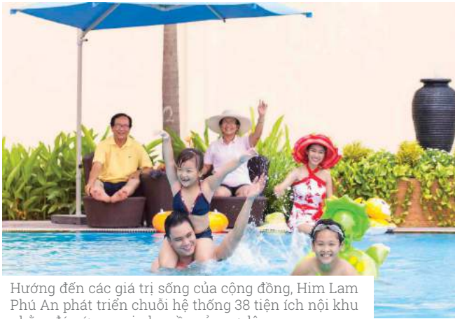
Hướng đến các giá trị sống của cộng đồng, Him Lam Phú An phát triển chuỗi hệ thống 38 tiện ích nội khu nhằm đáp ứng mọi nhu cầu của cư dân.

Bên cạnh đó, khi tuyến Metro được đưa vào sử dụng, cự ly kết nối giữa Him Lam Phú An tới Khu Công nghệ cao, Làng Đại học Quốc gia, Bệnh viện Quốc tế Vinmec, Trung tâm Thể dục Thể thao Rạch Chiếc... sẽ được rút ngắn đáng kể; hứa hẹn là nơi "hội tụ" của cộng đồng cư dân năng động, văn minh, trí thức trong khu vực.