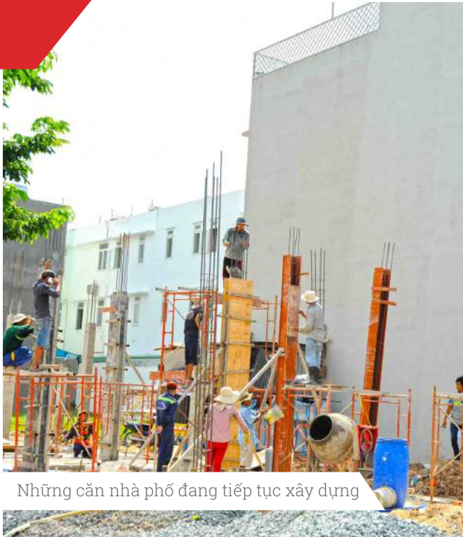
Những căn nhà phố đang tiếp tục xây dựng

HIM LAM PHÚ ĐÔNG — CUỘC SỐNG PHỒN VINH —