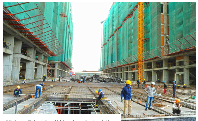
Hồ bơi - Tiện ích nội khu đang hoàn thiện