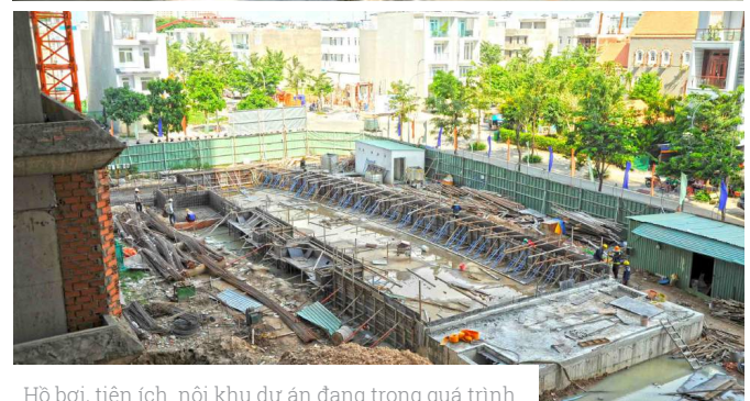
Hồ bơi, tiện ích nội khu dự án đang trong quá trình xây dựng.