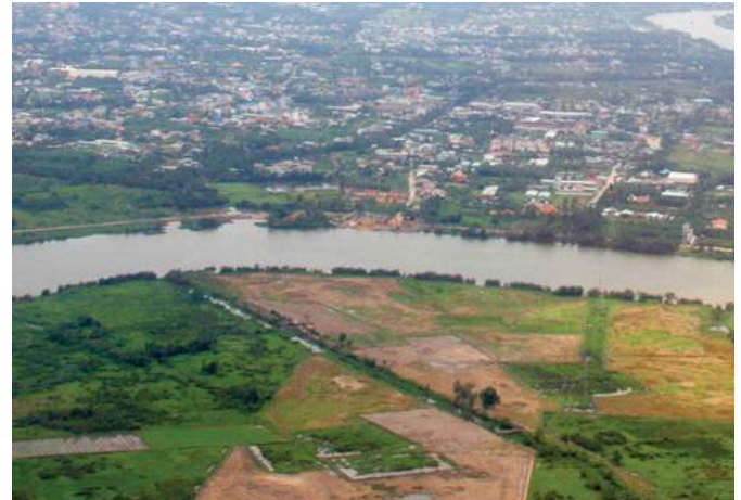
Tại trung tâm TP.HCM hiện rất khó tìm kiếm những ô đất đủ lớn để phát triển dự án.

Nhu cầu đầu tư phát triển dự án của các doanh nghiệp địa ốc tăng cao, trong khi quỹ đất sạch để phát triển dự án ở TP.HCM đang ngày càng khan hiếm. Và như một quy luật, cầu vượt cung đã khiến cho việc tạo lập quỹ đất ngày càng khó hơn không chỉ trong việc tìm kiếm quỹ đất mà là một cuộc cạnh tranh về giá cả.