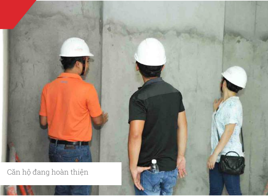
Căn hộ đang hoàn thiện