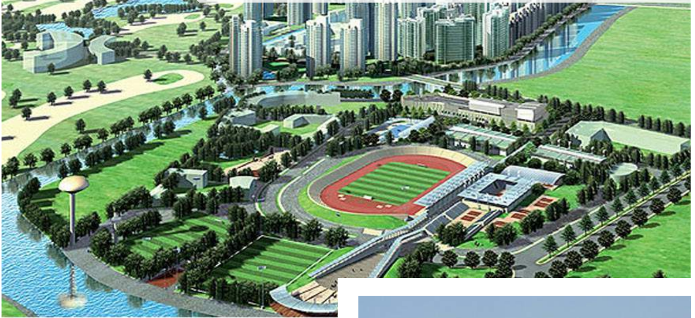
Phối cảnh sân vận động và Khu liên hợp thể thao Rạch Chiếc

N gay sau SEA Games 29, TP.HCM tiếp tục khẩn trương xúc tiến những công việc quan trọng liên quan đến đề án đăng cai SEA Games 31 năm 2021 để Chính phủ có thể sớm phê duyệt.