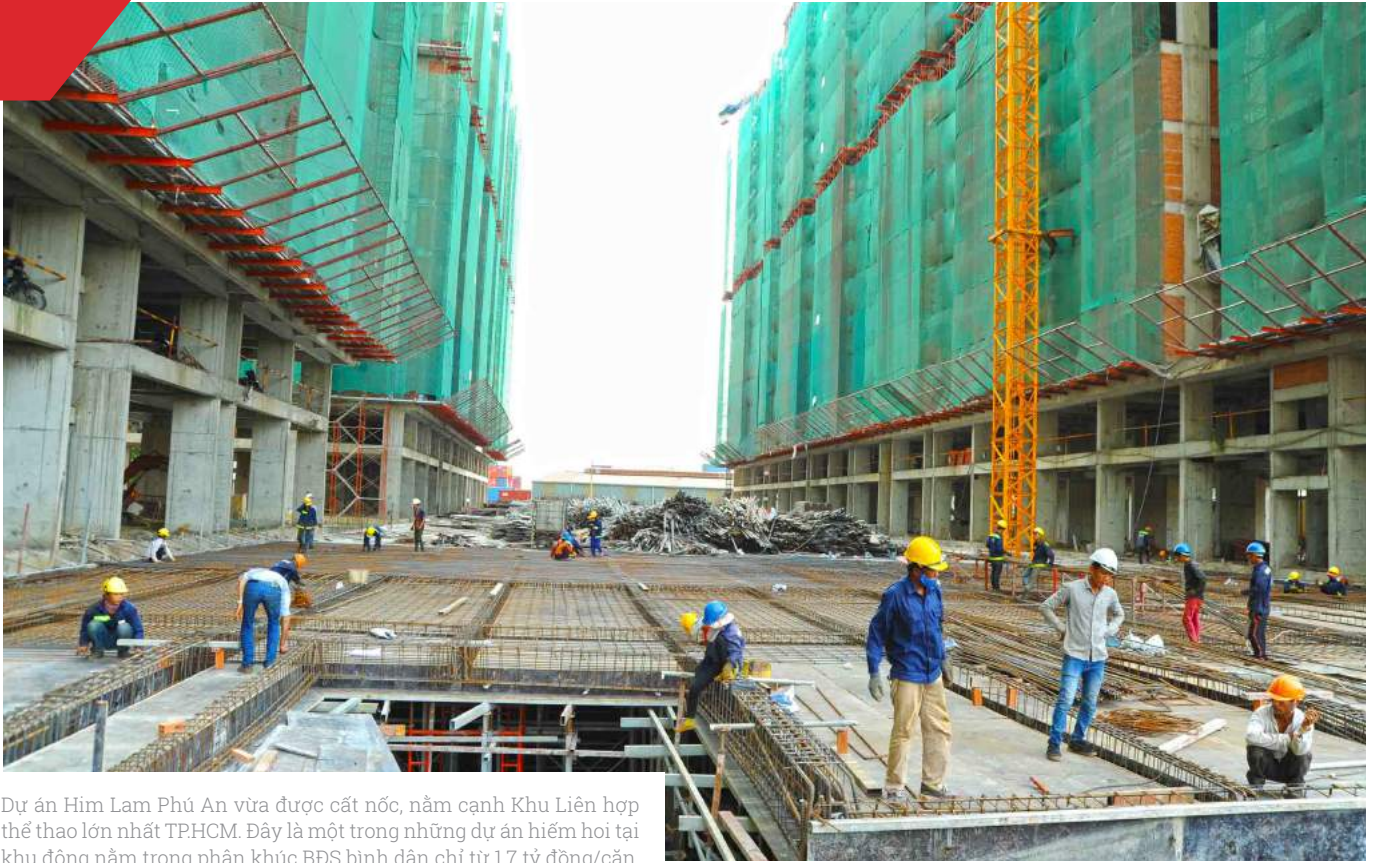
Dự án Him Lam Phú An vừa được cất nóc, nằm cạnh Khu Liên hợp thể thao lớn nhất TPHCM. Đây là một trong những dự án hiếm hoi tại khu đông nằm trong phân khúc BĐS bình dân chỉ từ 1,7 tỷ đồng/căn.