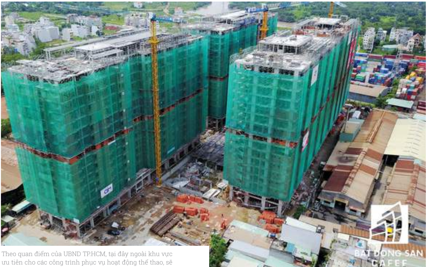
Theo quan điểm của UBND TPHCM, tại đây ngoài khu vực ưu tiên cho các công trình phục vụ hoạt động thể thao, sẽ kêu gọi đầu tư xây dựng các cụm trung tâm thương mại - văn phòng và hoàn toàn không có chức năng để ở.