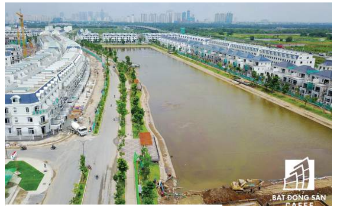
Hàng loạt dự án nhà ở, khu đô thị bao quanh Khu liên hợp thể thao.