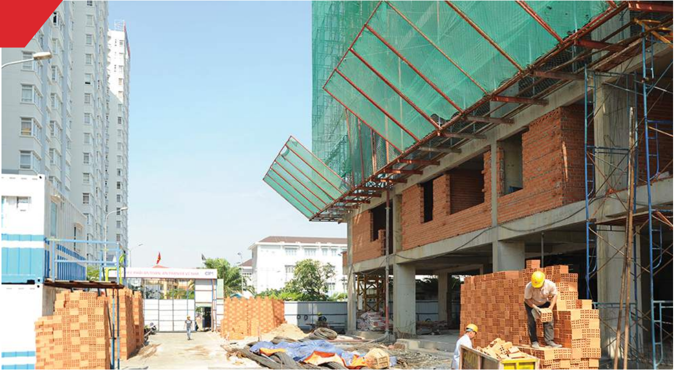
Block A: Him Lam Chợ Lớn - Giai đoạn 3 Đã cất nóc và đang hoàn thiện phần thô.