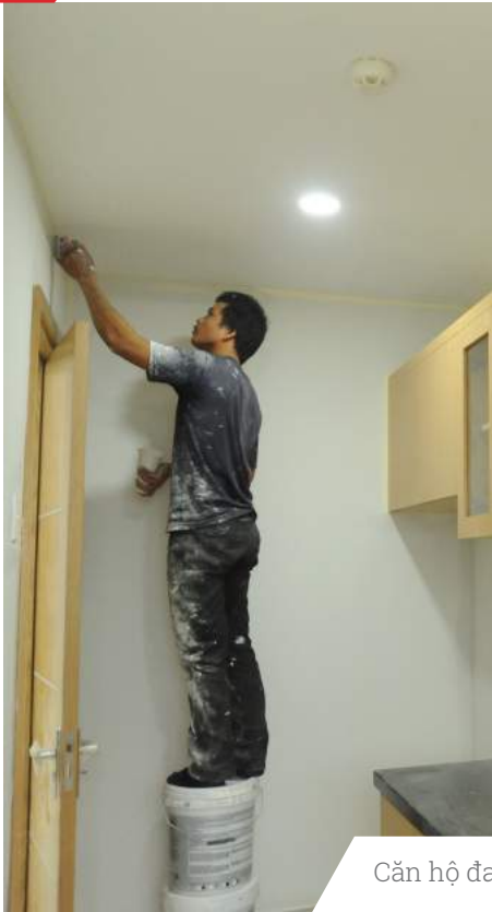
Căn hộ đang hoàn thiện