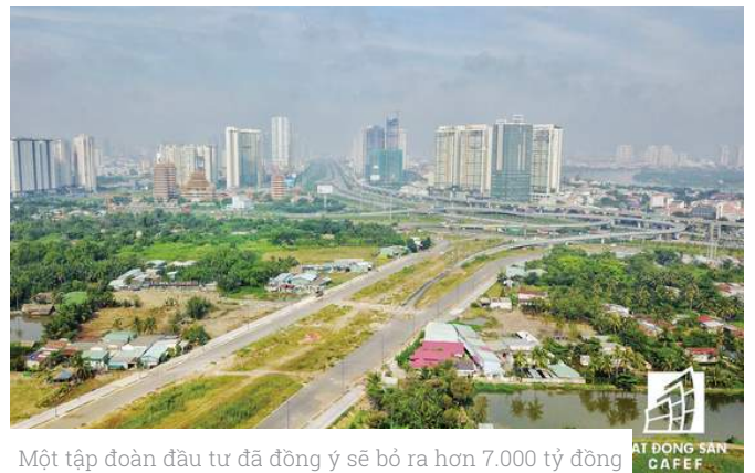
Một tập đoàn đầu tư đã đồng ý sẽ bỏ ra hơn 7.000 tỷ đồng để thực hiện công tác đền bù giải phóng mặt bằng, đổi lại doanh nghiệp này sẽ được thành phố giao cho một khu đất ở vị trí khác cho phát triển dự án nhà ở.