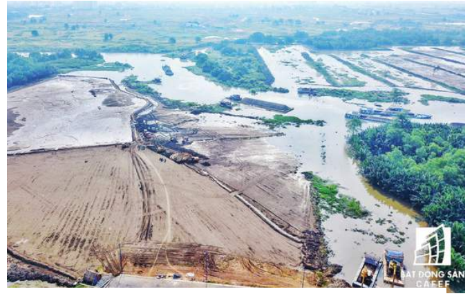
Hiện trạng khu liên hợp thể thao sau hơn 20 năm "trùm mền"