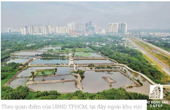
Theo quan điểm của UBND TPHCM, tại đây ngoài khu vực ưu tiên cho các công trình phục vụ hoạt động thể thao, sẽ kêu gọi đầu tư xây dựng các cụm trung tâm thương mại - văn phòng và hoàn toàn không có chức năng để ở.