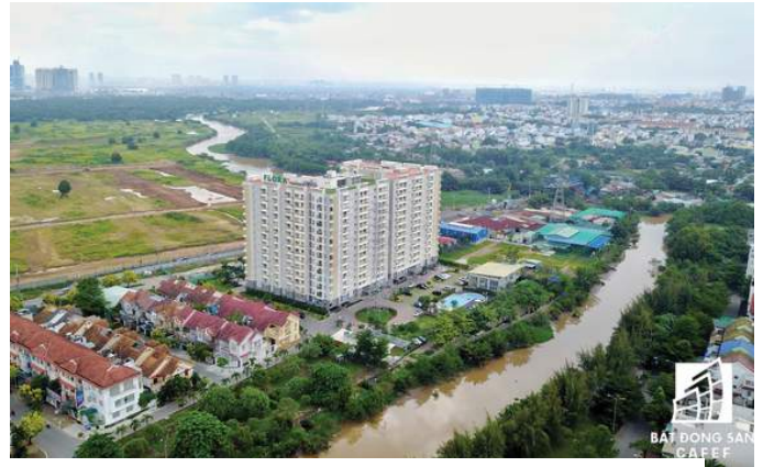
Nhiều dự án căn hộ của khu Đông cũng ghi nhận mức tăng giá mạnh so với năm ngoái.