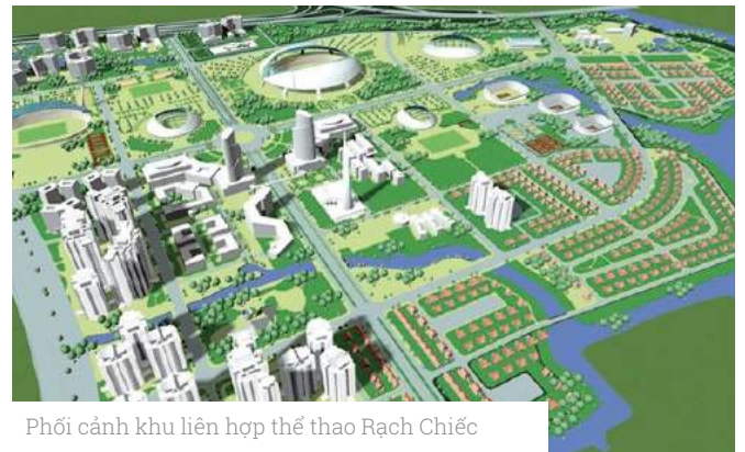
Phối cảnh khu liên hợp thể thao Rạch Chiếc

Được biết, Dự án Khu liên hợp thể dục thể thao Rạch Chiếc có chủ trương đầu tư từ năm 1994. UBND TP.HCM quyết định xây dựng dự án trên diện tích trên tổng thể 222 ha. Trong đó, 180 ha sẽ dùng đầu tư vào các cơ sở hạ tầng, trang thiết bị kỹ thuật.